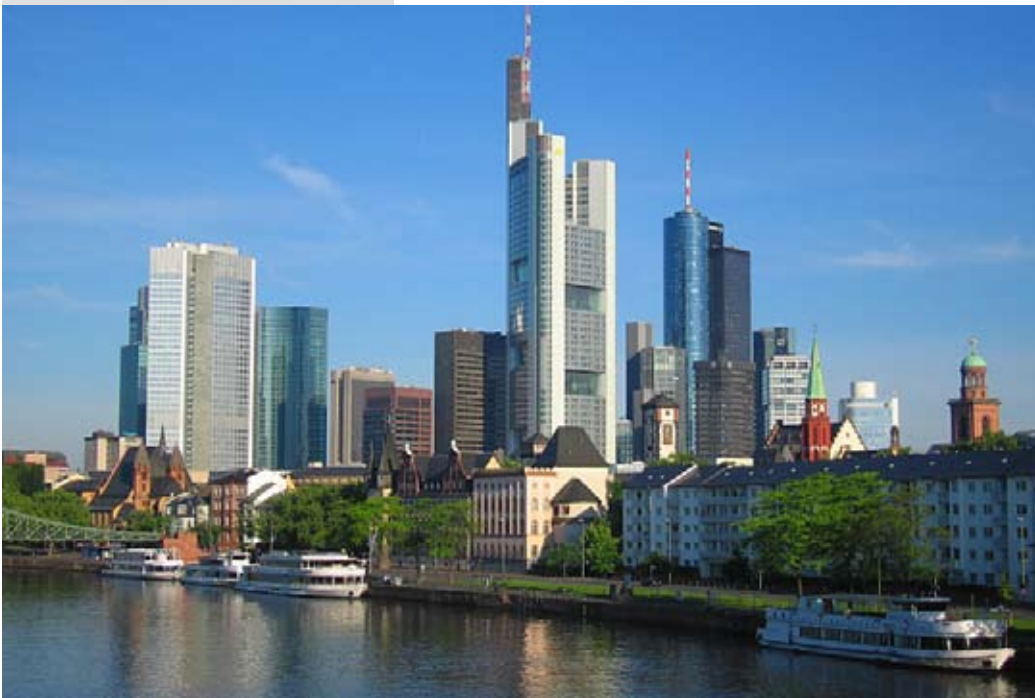
Auch in Frankfurt wurden weniger Flächen gebaut

Hilfreich könnte dabei nicht zuletzt auch der deutlich nachlassende Neubaudruck sein. Im Halbjahresvergleich wurden 2006 gegenüber dem