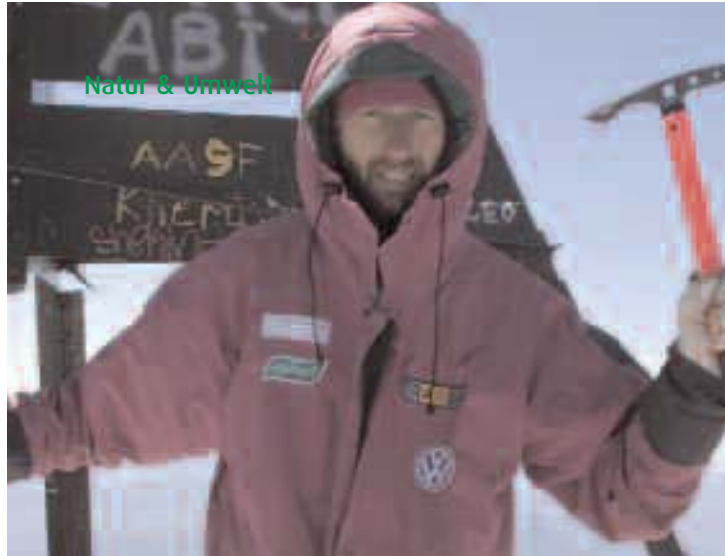
Natur & Umwelt

Mit seinen eindrücklichen Fotografien, seinen authentischen Ausführungen, seiner reichen Gedankenwelt sowie interessanten Hintergrundinformationen lässt Andrea Vogel einen weitgehend unbekanntem Teil unseres Planeten erlebbar werden. Er motiviert die Menschen, ihren eigenen Sehnsüchten nachzugehen und das scheinbar Unmögliche in die Tat umzusetzen. A.Vogel/Bioforce hat Andrea Vogel auf seiner Expedition massgeblich unterstützt.