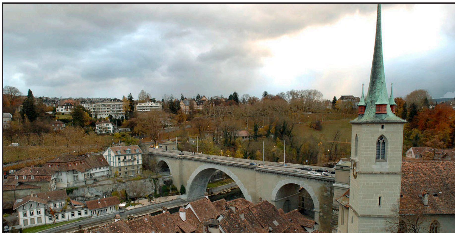
Nydeggkirche am unteren Ende der Berner Altstadt: Hier stand Pfarrer Kurt Marti bis 1983 auf der Kanzel.